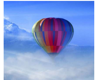
1. Devenir Manager Coach V2.docx 09/2022

Acquérir des compétences de coach pour développer sa pratique managériale